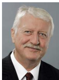
Dipl.-Kfm. Bernd Janssen Steuerberater Präsident der Steuerberater- kammer Hamburg